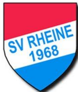
Schwimmverein Rheine 1968 e.V.

Veranstalter: Verband Deutscher Sporttaucher e.V. Jugend